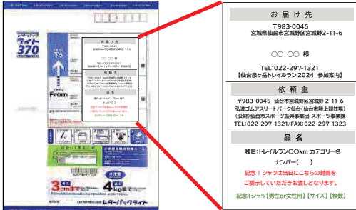
事前送付物レターパック

RUNET 申込者限定の大会記念Tシャツを購入された方は、 総合案内にて、レターパック記載のサイズ等の印字部分をご提示（封筒持参やスクリーンショットなど）のうえ、Tシャツをお受け取りください。