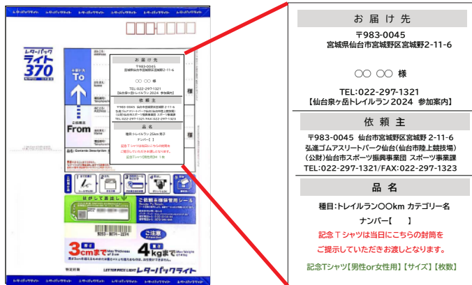
事前送付物レターパック

RUNET 申込者限定の大会記念Tシャツを購入された方は、 総合案内 にて、 レターパック記載のサイズ等の印字部分をご提示（封筒持参やスクリーンショットなど）のうえ 、Tシャツをお受け取りください。