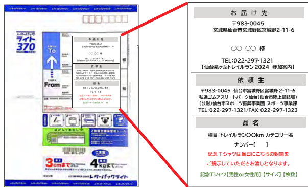
事前送付物レターパック

RUNET 申込者限定の大会記念Tシャツを購入された方は、 総合案内 にて、 レターパック記載のサイズ等の印字部分をご提示（封筒持参やスクリーンショットなど）のうえ、Tシャツをお受け取りください。