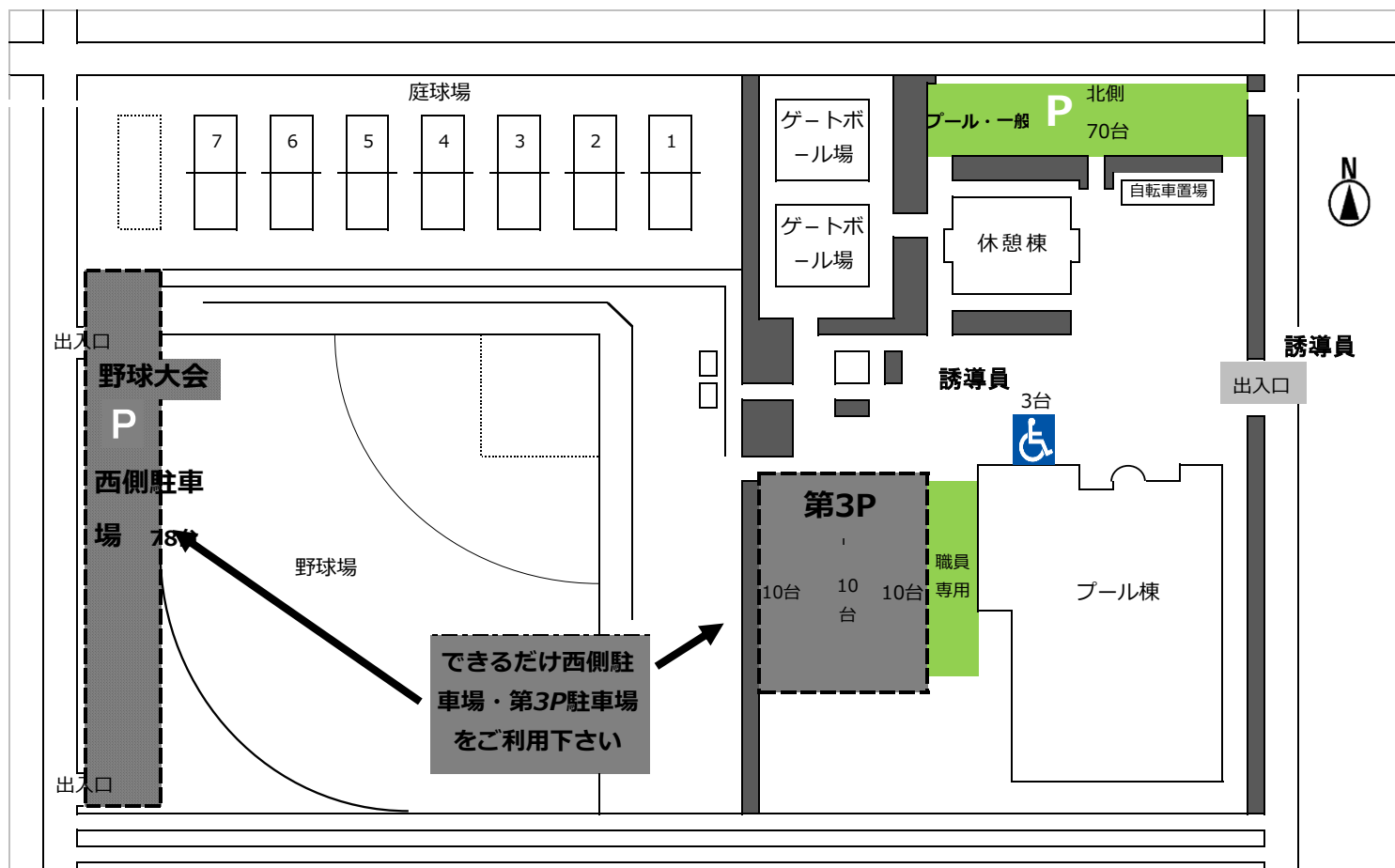
今泉運動場平面図

*詳しくは、優先仮予約本申し込み（入金）の時、今泉受付にて大会打ち合わせ等をお願い致します。